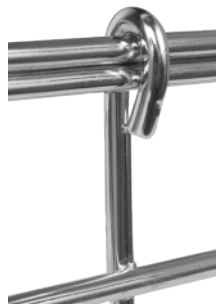
Borde de seguridad doble hilo